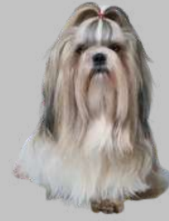
PELO NATURAL "SELLADO" No es poroso